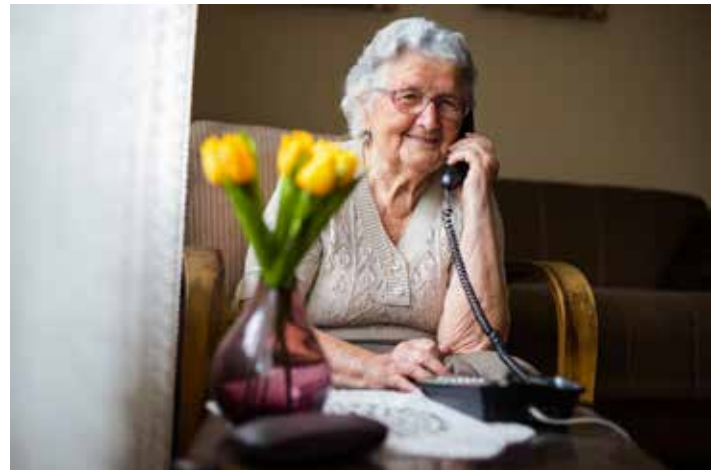
▲ Heel wat inwoners hadden nood aan een babbeltje. Via 'Sint-Pieters-Leeuw helpt' kwamen ze in contact met een vrijwilliger.

Veel inwoners zijn gelukkig goed omringd door familie of bureu. Voor wie die omkadering niet heeft, gaat de gemeente op zoek naar een geschikte vrijwilliger. Die helpt dan onder meer met boodschappen doen, de hond uitlaten of naar de apotheek gaan. Vaak hebben mensen ook gewoon nood aan een babbeltje via de telefoon of Skype.