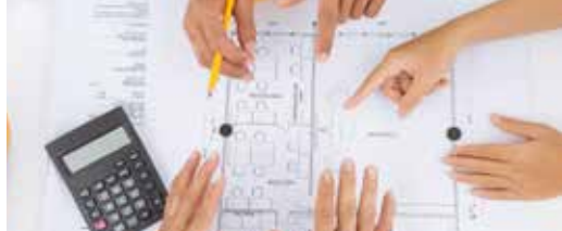
Bouwstop voor nieuwe verkavelingen (p. 5)