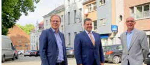
Omgeving Rink in een nieuw kleedje p.2