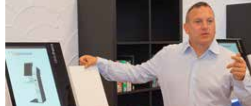
Bibliotheek gaat mee met haar tijd p.3