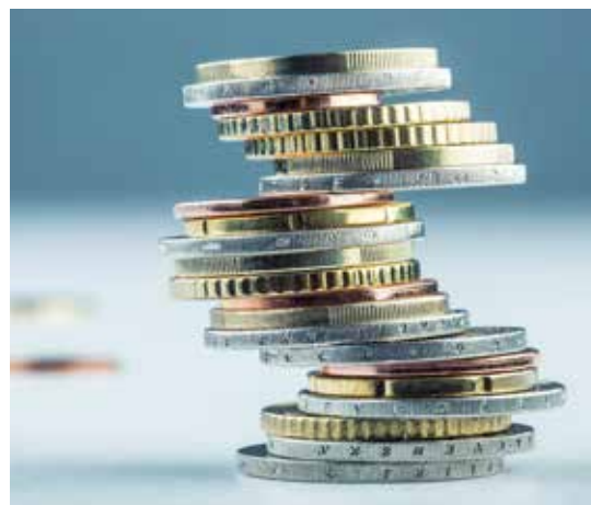
▲ Wij gaan verantwoord om met de middelen. Zo is er ruimte om te investeren.

Het resultaat is dat we op het hele pakket zomaar even 147 000 euro per jaar kunnen besparen. Op een hele bestuursperiode is dat al snel een kleine 900 000 euro.