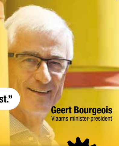
Geert Bourgeois Vlaams minister-president

“Deze Vlaamse Regering beslist, hervormt en tekent het Vlaanderen van de toekomst.”