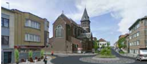
Perspectief voor Ruisbroek p.2