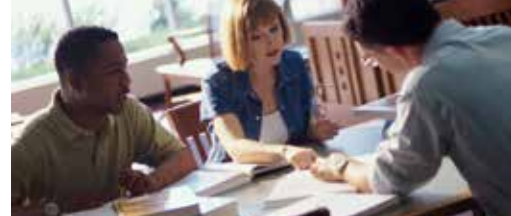
Toeleiding van nieuwkomers p.3