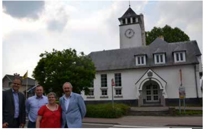
Een nieuwe impuls in een mooi historisch kader voor de deelgemeente Vlezenbeek ▲

N-VA Sint-Pieters-Leeuw staat volledig achter dit initiatief. Zeker na de sluiting van heel wat cafés – en onlangs nog een restaurant – in het dorp. Wie interesse heeft om deze uitdaging aan te gaan, kan zich kandidaat stellen tot 31 juli 2016.